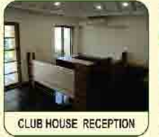
CLUB HOUSE RECEPTION